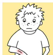
SPORO ZARASTANJE RANA

Hiperglikemija je medicinski izraz za povišenu vrijednost glukoze u krvi (GUK). Ako su vrijednosti GUK-a jako visoke ( > 15 mmol/l) vaša bolest je loše regulisana pa trebate provjeriti ketone u mokraći. Dobro regulisan dijabetes podrazumijeva da su vrijednosti glukoze u krvi između 6 i 10 mmol/l i glikolizirani hemoglobin, HBA1c <7\% .