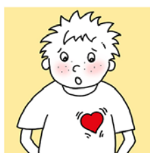
UBRZAN RAD SRCA